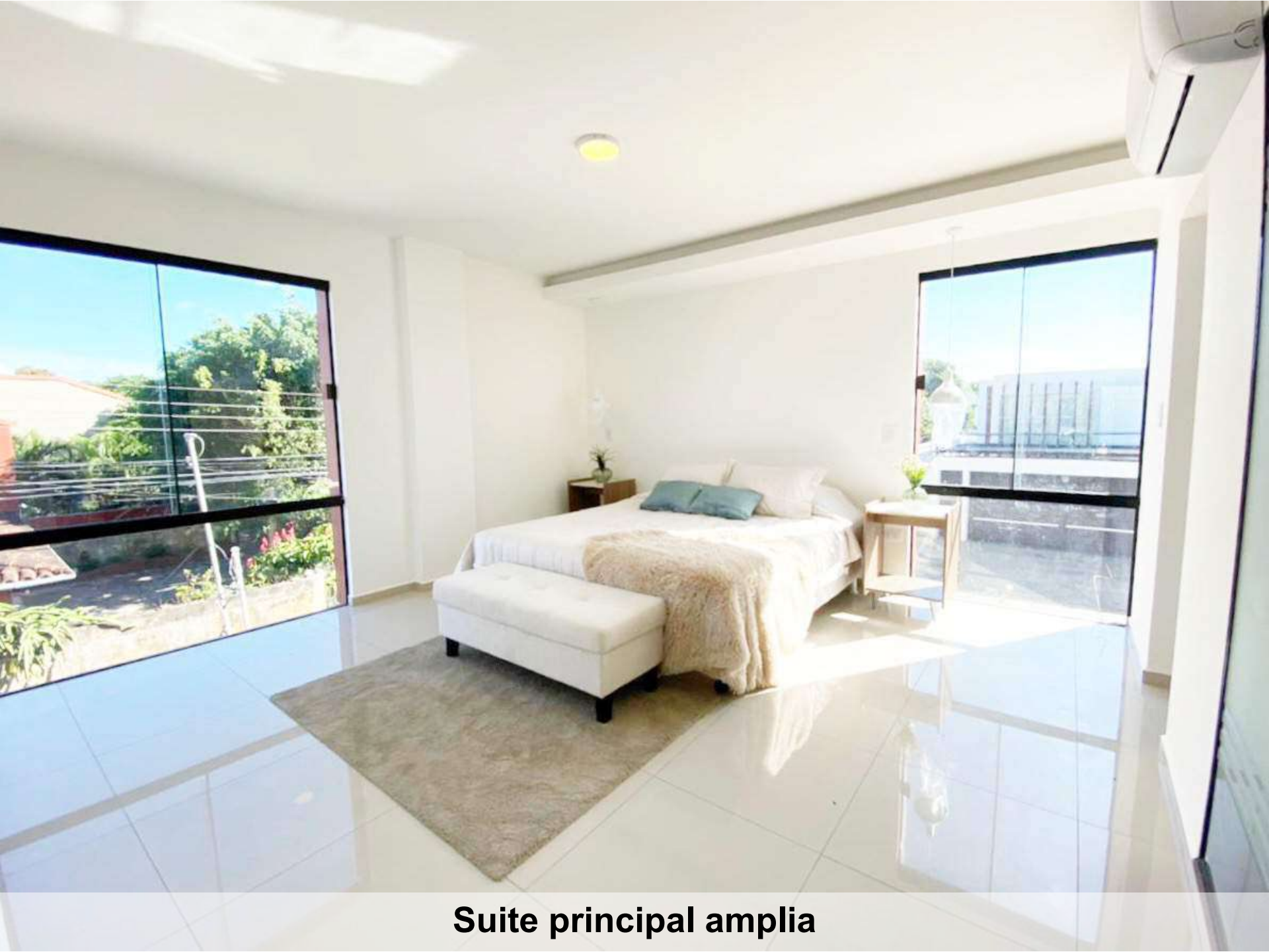
Suite principal ampla