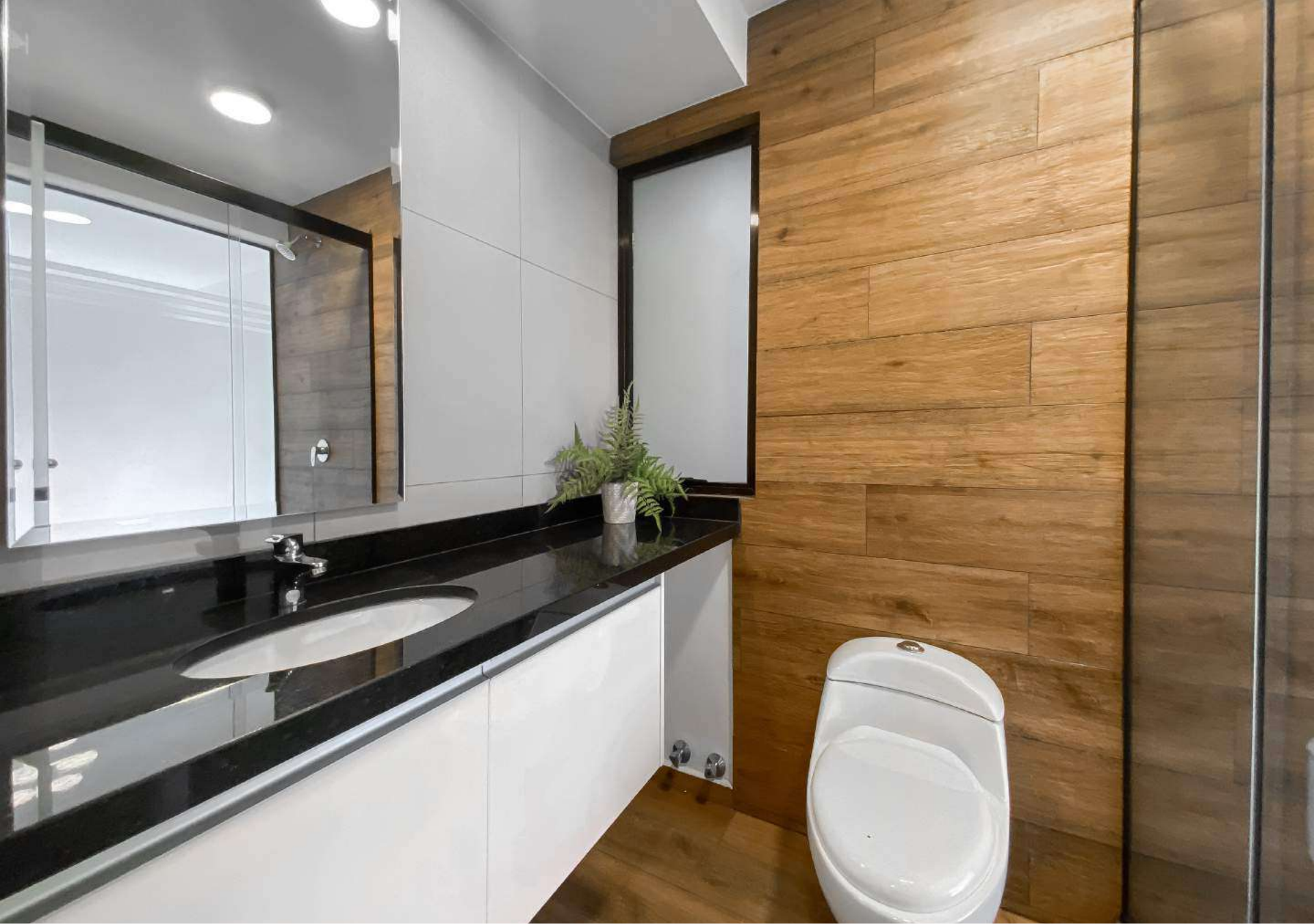
Baños completamente equipados y revestidos