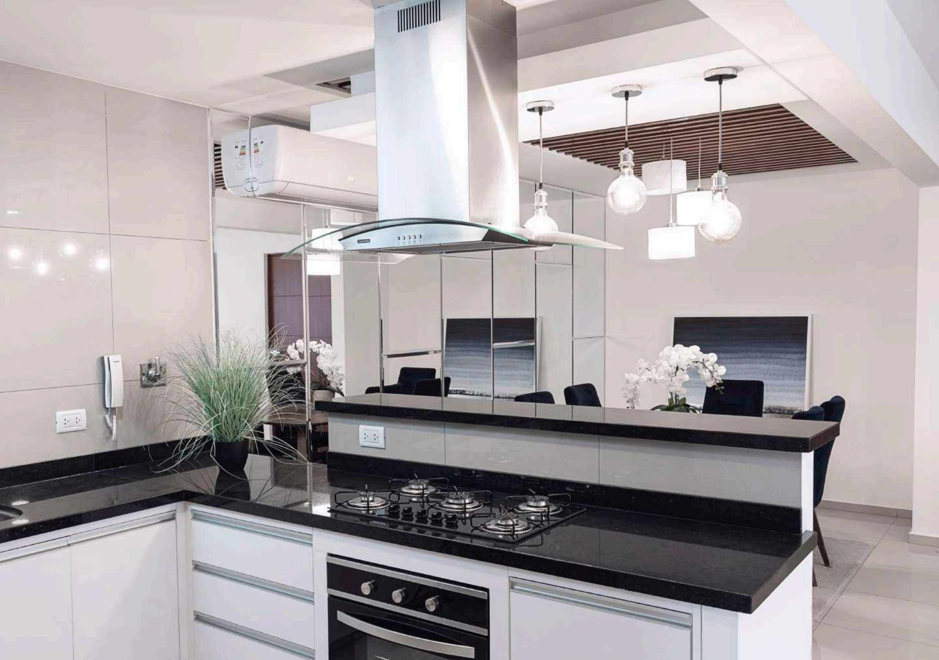
Cocina con mesón de granito Chiquitano y muebles bajos