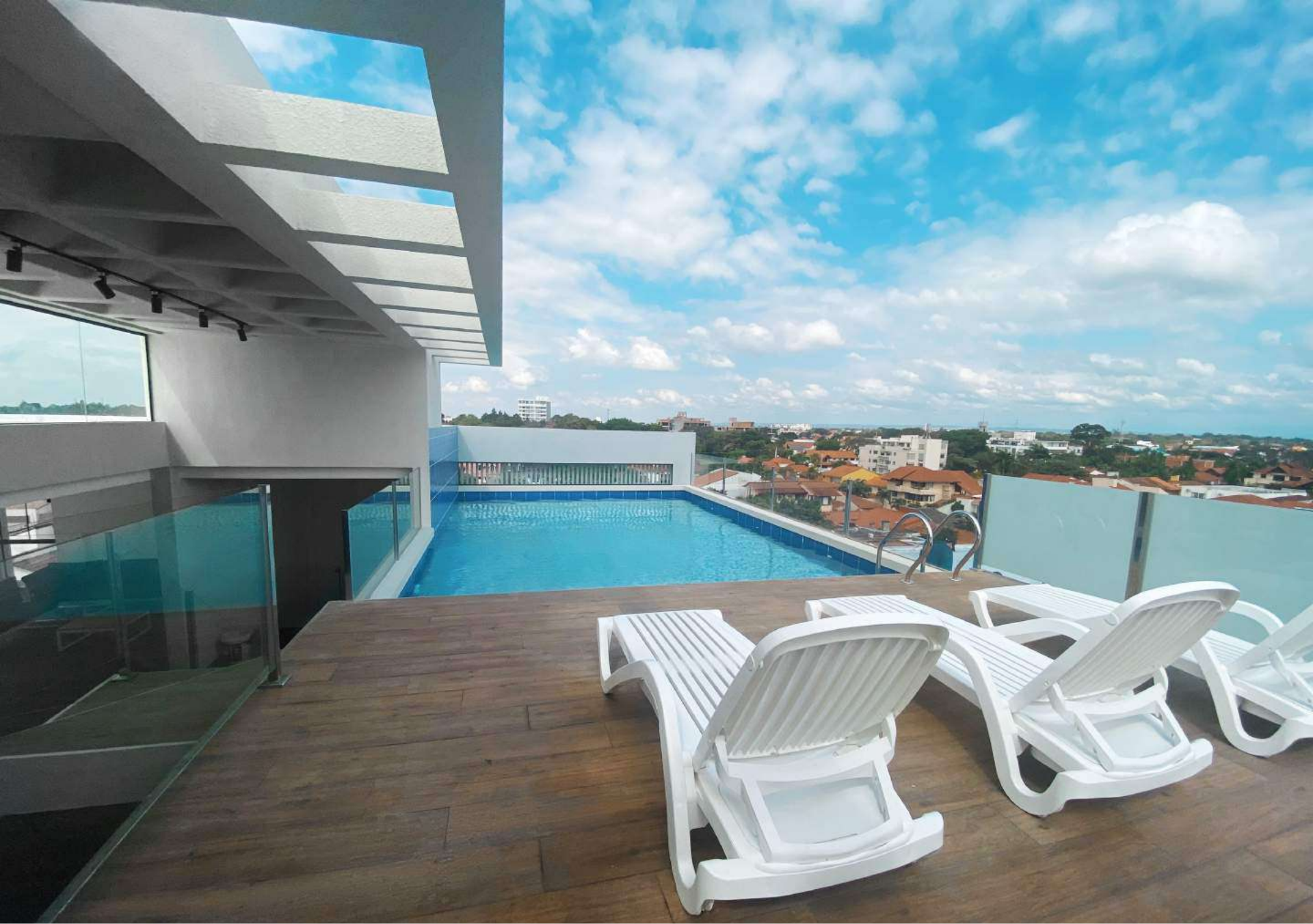
Piscina con hermosa vista