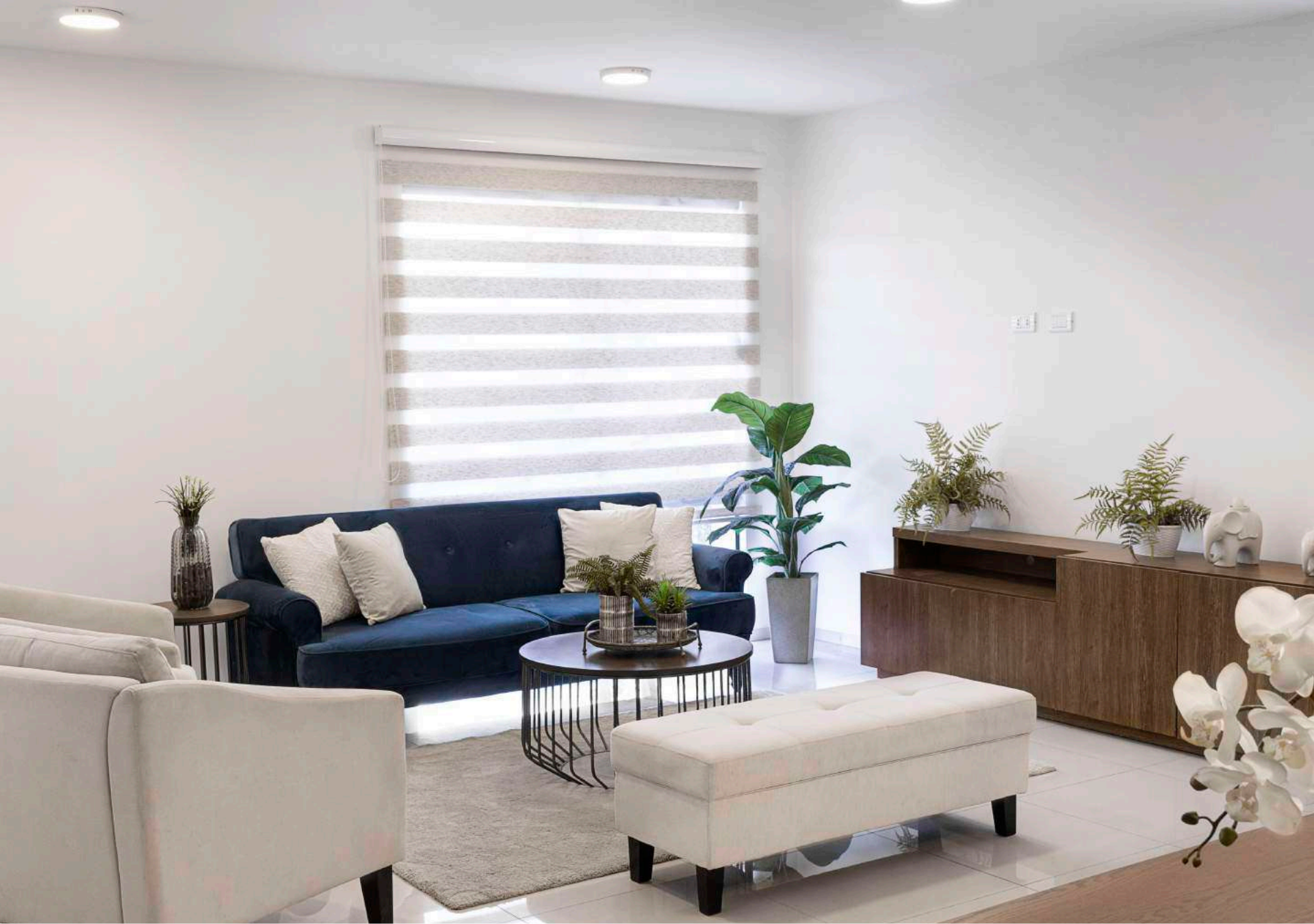
Sala ampla e iluminada